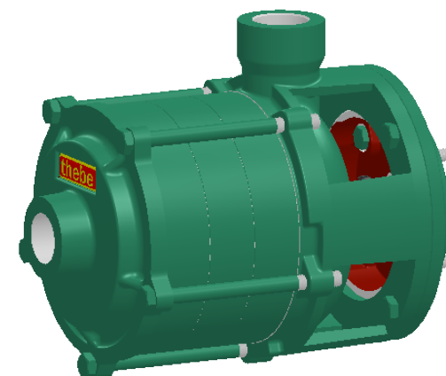
Tabela geral Diâmetro Bronze Alumínio 108x3 mm 00738 01128